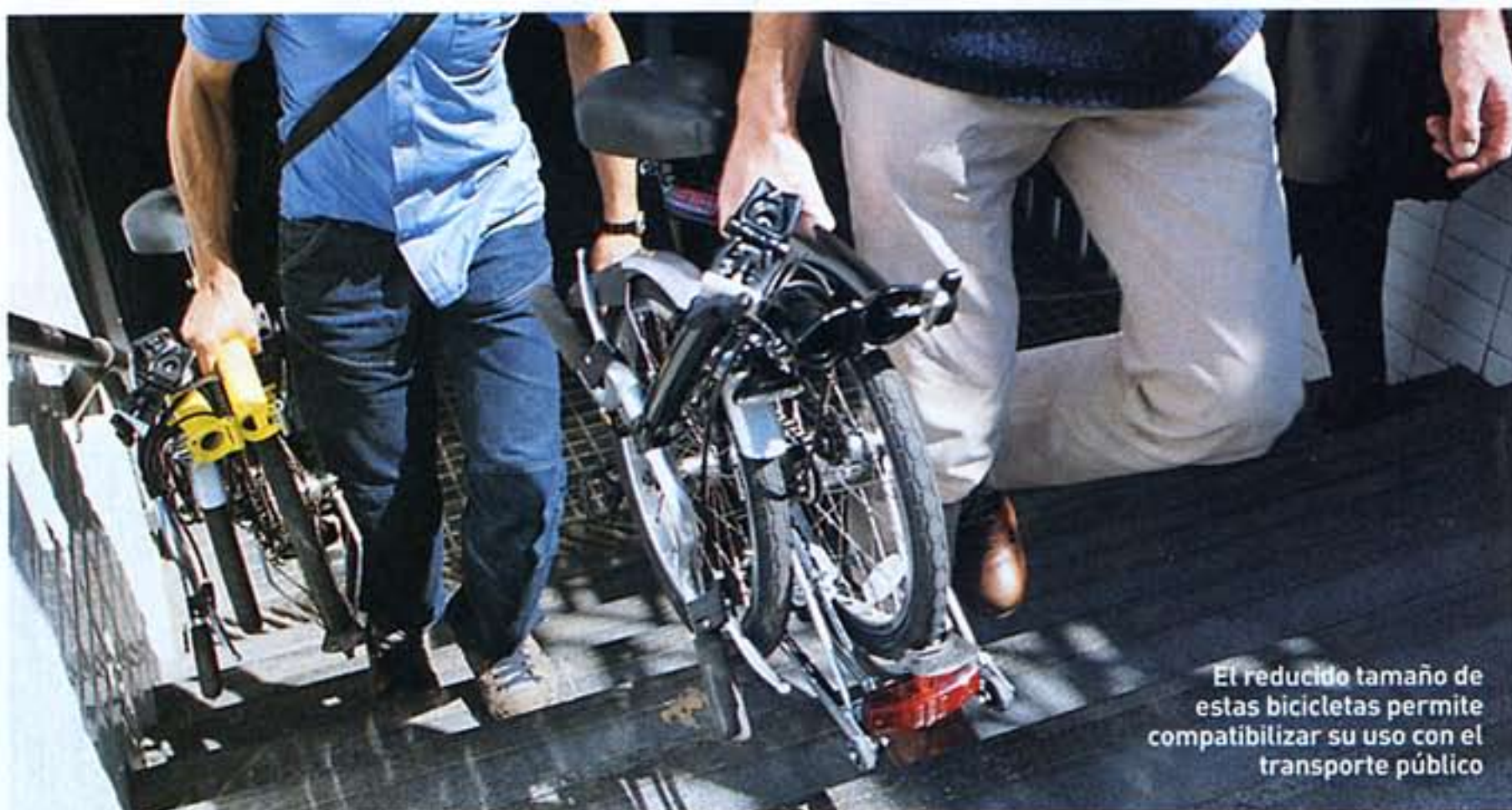
El reducido tamaño de estas bicicletas permite compatibilizar su uso con el transporte público

El cambio de marchas de estas bicis es especial, con un solo plato y un único piñón. El cambio de marchas incorporado (la cadena no rueda en-